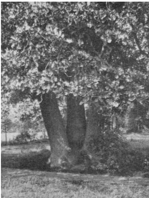
De drie heilige eiken.

Wij hadden van de Almeloosche brug aanstonds er heen kunnen gaan, doch nu wij zoover de laan