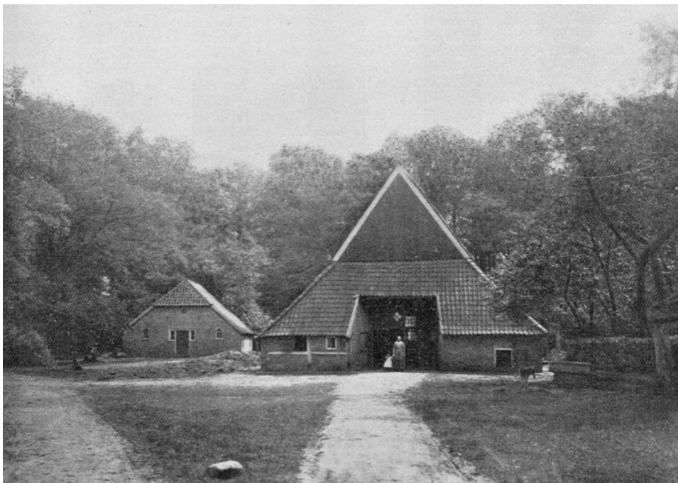
Boerderij te Buren.

Borne op dezen weg uit, die juist buiten het dorp van den straatweg naar Hengeloo zich afbuigt en langs de Lemerij loopt. Er is nog een korter pad, dat ingaat naast de villa van den heer S. Spanjaard en over den Steenoven loopt en iets verder op den weg naar Buren uitkomt. Als wij dan de brug bij 't Schild over zijn en linksom gaan, krijgen wij een dubbele laan voor ons uit. Aan den weg ligt links eene boerderij en de weg slingert zich door eschgronden en boerderijen tot een tweesprong, rechts, langs een dennenbos en, komt het pad van Borne op den grooten weg. Weldra zien wij voor ons een jachtpaal van Twick-