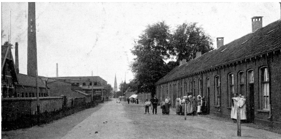
De Deldensestraat in de richting van het dorp. Links het zogenaamde "kleine fabriekje": de Bornesche Stoomweverij en Ververij. Rechts de woningen van de rode lap.

leeg te malen, maar dient alleen, om in tijden van droogte, als de fabrieken der HH. Spanjaard gebrek aan water hebben, deze van uit dien plas er van te voorzien.