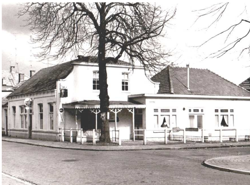
Het café Landkroon aan de Stationsstraat met de uitbouw aan de Dunantstraat in het begin van de jaren vijftig van de vorige eeuw. Café links uit 1887, rechts de aangebouwde zaal uit 1931.

In 1931 wordt een zaal bij het café aangebouwd. Niet groot maar ruim genoeg om hier te vergaderen, een bruiloft te vieren of een voorstelling te geven. Ook verschillende sportverenigingen maakten er gebruik van. Voor allerlei feesten kon de zaal worden gehuurd.